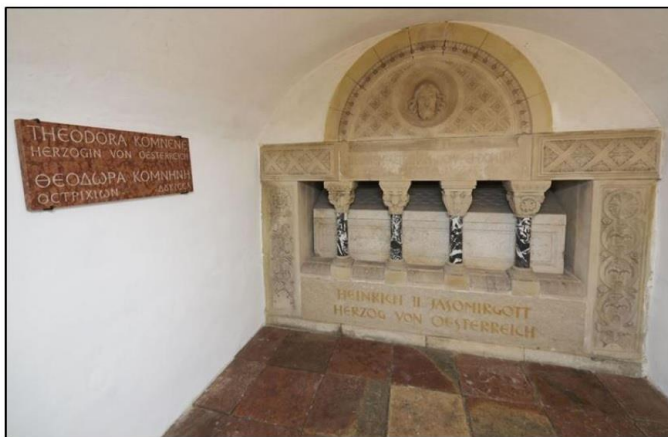
Grab der Theodora Komnene und ihres Ehemanns Herzog Heinrich II. von Österreich in der Krypta der Schottenkirche in Wien