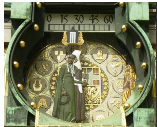
Theodora Angelina und ihre Ehemann Herzog Leopold VI. von Österreich auf der Ankeruhr (Wien, Hoher Markt)